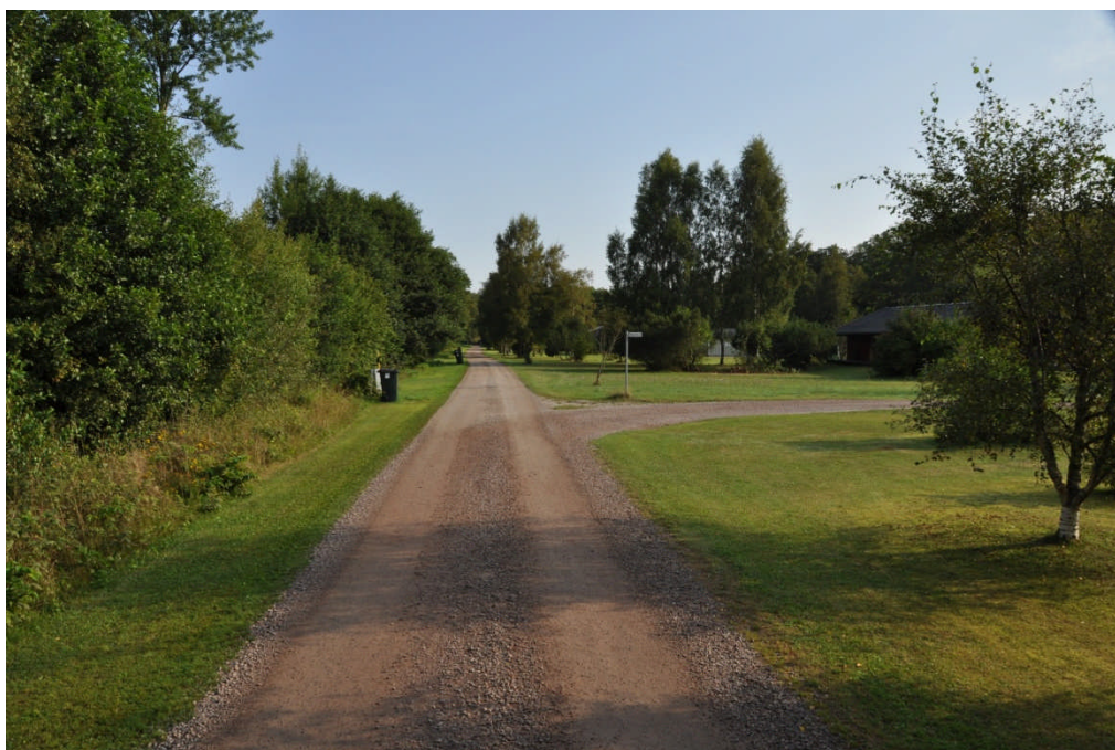
Storsvängen väster (norrut)